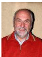
Werner Götz (kein Bild)